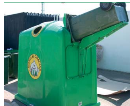
Contenedor vaci adaptado al sector hostelero para facilitar el reciclado de vidrio.

Actualmente existe una gran involucración de los hosteleros en reciclar vidrio. En estos momentos más de 10.000 locales hosteleros de toda España (Comunidad Valenciana, Galicia, Andalucía, Cantabria, Castilla y León, Murcia, Navarra, País Vasco, Madrid...) partici-